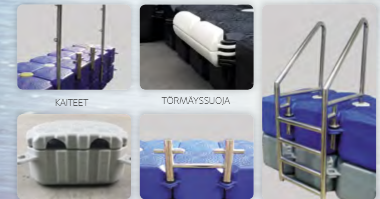
ERIKOISMODUULI JOHTOJEN LÄPIVIENIÄ VARTEN